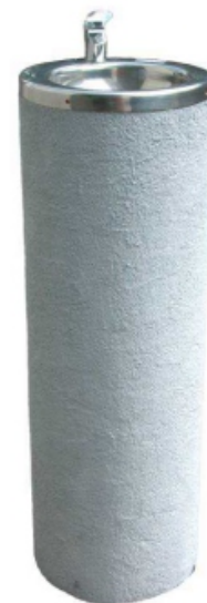
Zdrój wody pitnej nr kat. 1710 kolumna strukturalna