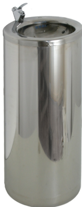
Zdrój wody pitnej nr kat. 1700 kolumna stal nierdzewna